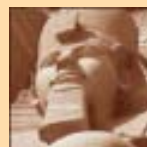
Nubiska monument från Abu Simbel till Philae (1979)