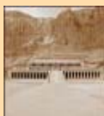
Gamla Thebe med dess nekropol (1979)