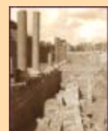
Abu Mena vid Alexandria (1979)